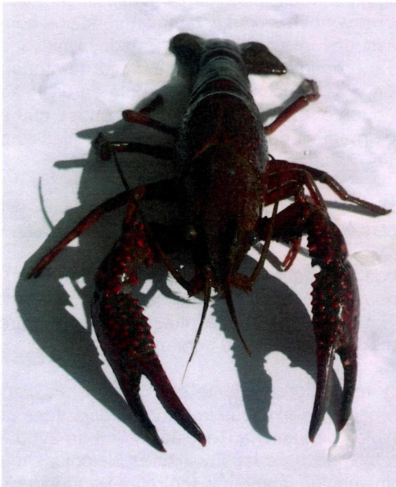
Fotografía 1. Procambarus clarkii . Vista dorsal