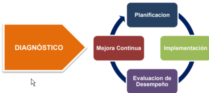
Figura 1 – Ciclo de Operación de seguridad y privacidad de la Información