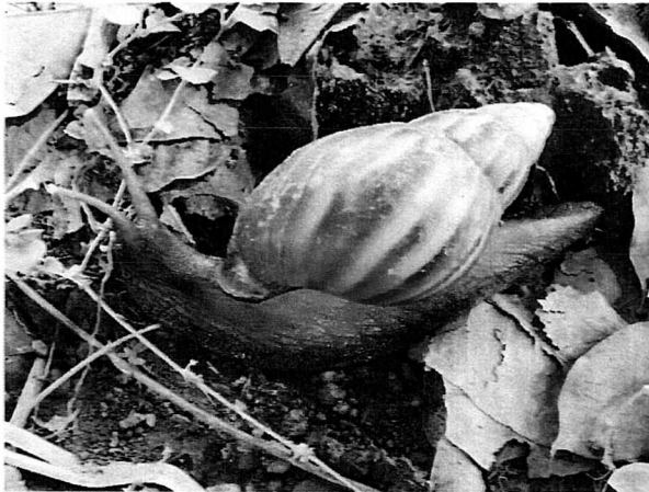
Fotografía 1. Vista lateral de Achatina fulica

bandas longitudinales grandes e irregulares de color violeta oscuro sobre un fondo amarillo claro. La cabeza posee dos pares de tentáculos, uno corto y otro largo, que porta los ojos en los extremos; cuenta con una estructura bucal dotada de múltiples dientes (Fotografías 1 y 2).