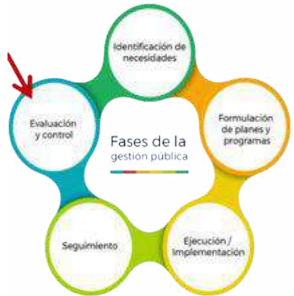
Figura 1. Fases de la Gestión pública

En el contexto de rendición de cuentas, este ciclo asegura la transparencia y la participación ciudadana, pues cada fase debe ser documentada y publicada, permitiendo que la ciudadanía y otras partes interesadas verifiquen los avances y resultados, garantizando la responsabilidad institucional y el cumplimiento de la normatividad ambiental.