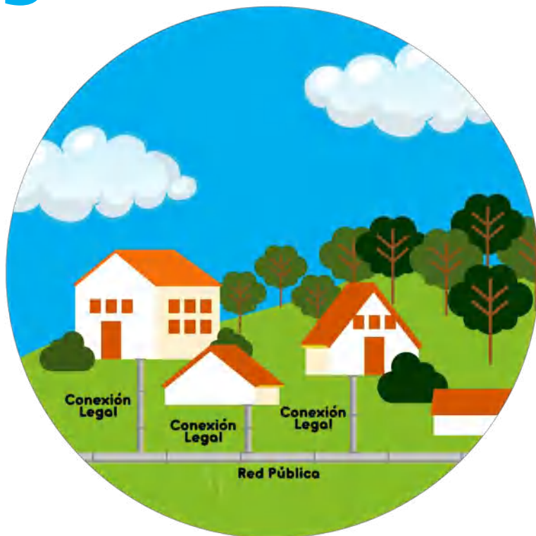
Conexión a la red de alcantarillado público

Las opciones que dentro del marco normativo se contemplan para la disposición de aguas residuales, son: