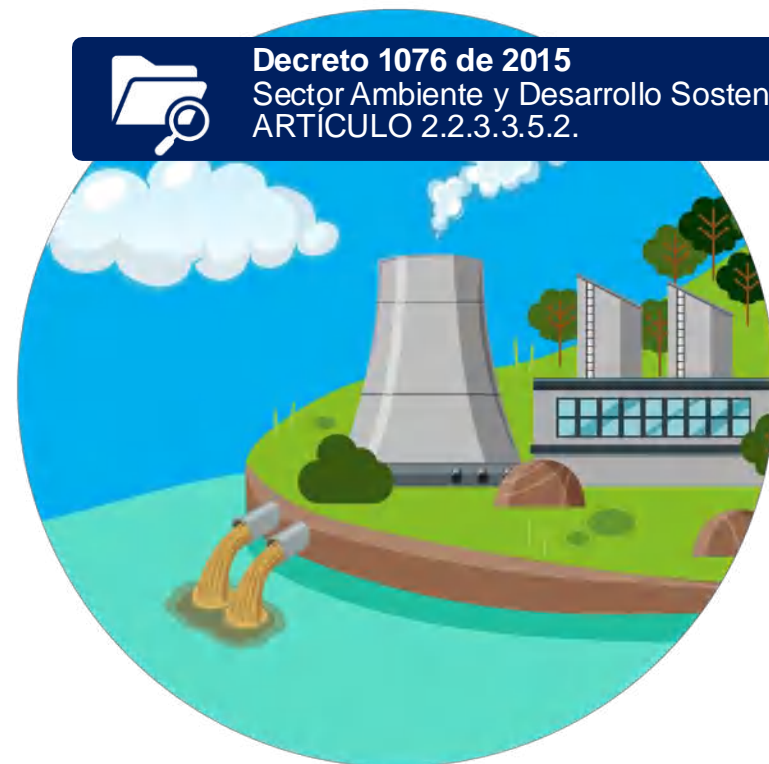
Descarga a una fuente hídrica